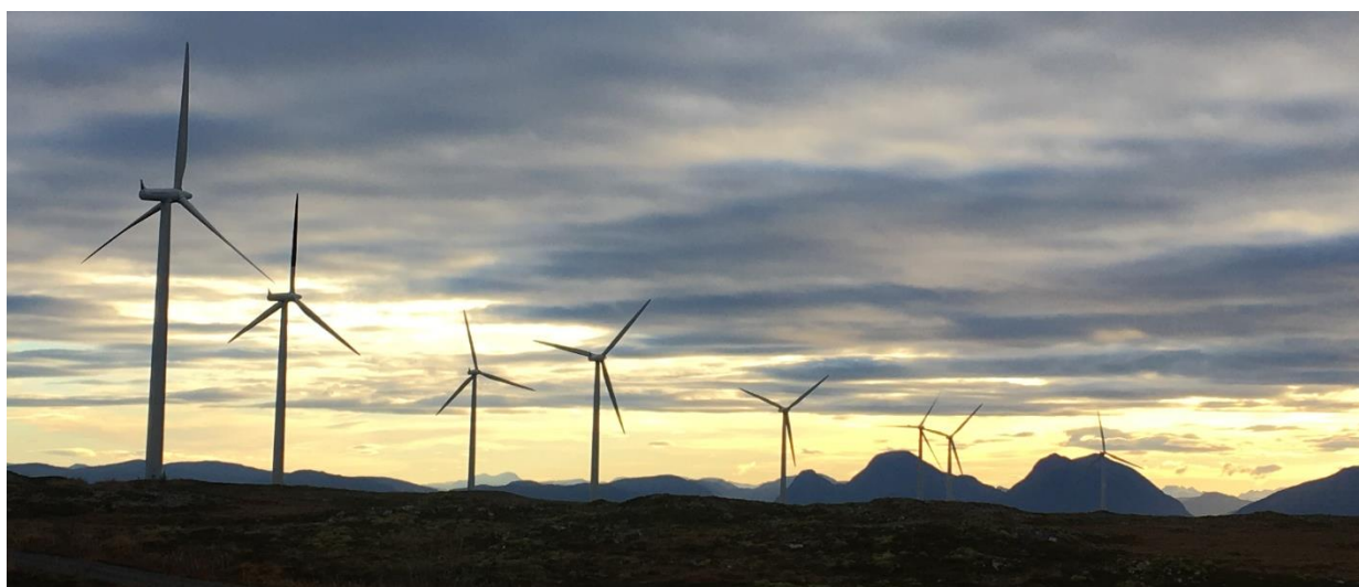
Smøla vindkraftverk